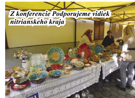
Z konferencie Podporujeme vidiek nitrianskeho kraja