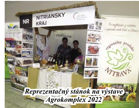
Reprezentačný stánok na výstave Agrokomples 2022

ciach, kde budú mať možnosť sa prezentovať miestni výrobcovia, producenti a poskytovatelia služieb (držitelia regionálnej značky kvality), ale aj všetci z územia MAS, ktorí budú mať záujem o propagovanie svojej práce. Regionálny jesenný jarmok je každoročne čoraz kvalitnejším festivalom práce, chuti a vône nášho regiónu.