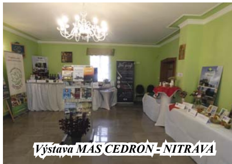
Výstava MAS CEDRON – NITRAVA

Je potešujúce, že úroveň a kvalita našich tradičných jarmokov sa z roka na rok zvyšuje. Súčasťou každého jarmoku je vždy aj regionálny kultúrny program, do ktorého sa v tomto roku zapojili obce Cabaj-Čápor, Černík, Jatov, Komjatice, Lipová, Mojmirovce, Palárikovo, Poľný Kesov, Rastislavice, Svätoplukovo, Šurany. V rámci stánkov sa prezentovali obce Kmeťovo, Michal nad Žitavou, Svätoplukovo, Šurany, Úľany nad Žitavou.