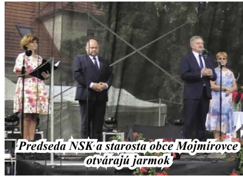
Predseda NSK a starosta obce Mojmirovce otvárajú jarmok

V. regionálny jesenný jarmok MAS CEDRON – NITRAVA sa konal na Námestí sv. Ladislava v Mojmirovciach a bol súčasťou Dní obce Mojmirovce.