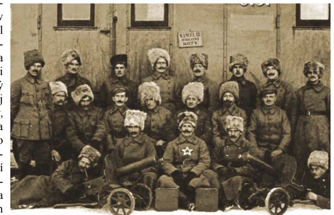
Slovenskí legionári v Rusku na Sibíri 1917-1920.