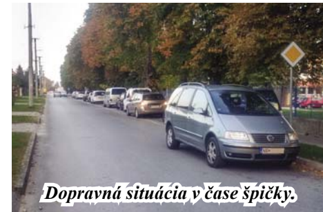
Dopravná situácia v čase špičky.

Rodičov detí v základnej a materskej škole, ako aj obyvateľov Školskej ulice roky trápila dopravná situácia pred školou. Ráno sa tvorili kolóny, pretože odstavené autá dočasne blokovali jeden jazdný pruh. Preto obec v spolupráci s vedením ZŠ v lete pristúpili k rozšíreniu chodníka s možnosťou krátkodobého odstavenia áut.