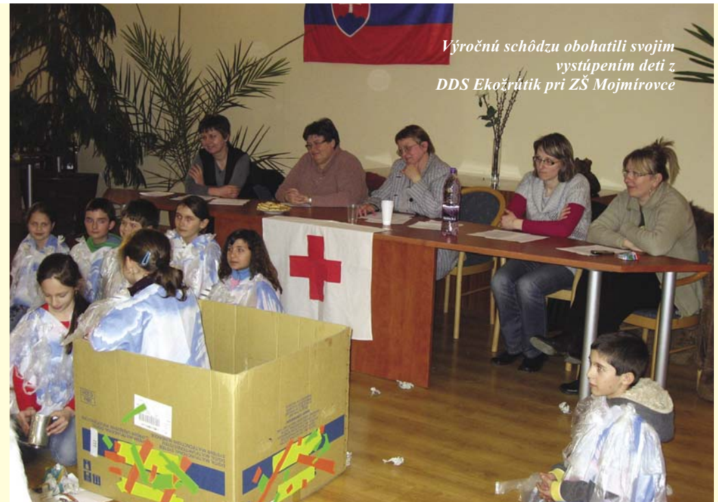
Výročnú schôdzu obohatili svojim vystúpením deti z DDS Ekožrútk pri ZŠ Mojmirovce

Z ostatných aktivít, členovia miestneho spolku okrem už tradične zabezpečených zdravotných hliadok na verejných podujatiach v obci, podporili deti zo sociálne slabších rodín, ktorým zabezpečili bezplatnú účasť na cirkusovom predstavení, zorganizovali prednášku poskytovania prvej pomoci miestnemu športovému klubu, zorganizovali verejnú zbierku Deň narcisov, do ktorej sa zapojili aj žiaci základnej školy. Výnos zbierky – dar obyvateľov našej obce v čiastke