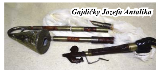
Gajdičky Jozefa Antalíka

Neskôr človek zdokonalil nástroj tak, že priviazal k píšťalkám kožený mech, mechúr, ba pridal tretiu dlhú píšťalku, hlboko stáloznejúci znejúci bas – tzv. huk. Tak burdón – stáloznejúci nemenný tón (vydávaný hukom) nám dáva kvalitu istoty, stability, o ktorú sa môžeme v každom prípade oprieť. Niektoré gajdy huk nemajú (napr. pontské gajdy tulum, tulumí, či marijský šuvir). Dôležitou súčasťou gajdovania je bohaté cifrovanie melódie. Je to znejúca ornamentika času, neustála zmena, ktorá sprevádza život každého tvora na Zemi. Keďže gajdy sú určené