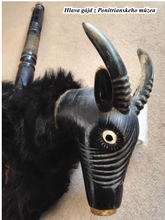
Hlava gajdy z Ponitrianskeho múzea

Gajdy predstavujú nielen melodický, rytmický a harmonický dychový hudobný nástroj; sú považované za prechodový – liminálny nástroj, ktorý pomáha prekonať zlomové obdobia, meniace sa životné situácie počas rituálov. Sú to napríklad sezónne prechody zo zimy do predjara a jari – fašiangy, kedy je životne potrebné „naštartovať“ vitálne plodorodné sily Zeme. Človek sa vtedy ocitá v existenčnej a potravinovej „neistote“ a obave o budúcu úrodu. Povedané symbolikou gréckej mytológie: či aj tejto jari Persefona vystúpi z podsvetia boha Háda, aby sa svet po zime opäť rozzelenal? Toto bol pocit starovekého človeka.