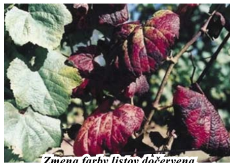
Zmena farby listov dočervena

vzdialenosti. Dospelé jedince tohto vektora sa vyskytujú až do septembra. Samčekovia sú pri prenose viničovej choroby efektívnejší ako samicke. Spomenutá fytoplasma sa šíri aj infikovanými sadenicami viniča.