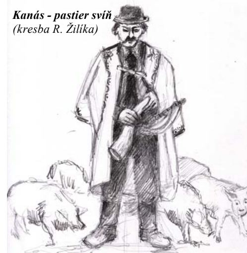
Kanás - pastier sviň (kresba R. Žilíka)

do tanca (na dolniakoch sa pri gajdošovi tancuje), hudba je rytmicky posilnená špecifickou hrou – kontrovaním na jednej z píšťaliek gajdice tzv. kontrovej v intervale kvarty – prikrývaním a odkrývaním dierky. Ak budeme počúvať gajdovanie dlhšie, dostaví sa stav tranzu, až zmenený stav vedomia. To vysvetľuje, prečo sa v starom príbehu spomínajú gajdy, ktoré samé hrali pod posteľou na Fuchsovom majíri v Urmíne. Gajdoš sa stáva šamanom, ktorý lieči, učí, sprevádza nás priestorom i časom, vešti – predpovedá.