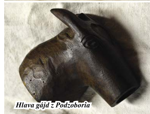
Hlava gajdy z Podzoboria