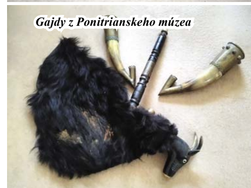
Gajdy z Ponitrianskeho múzea