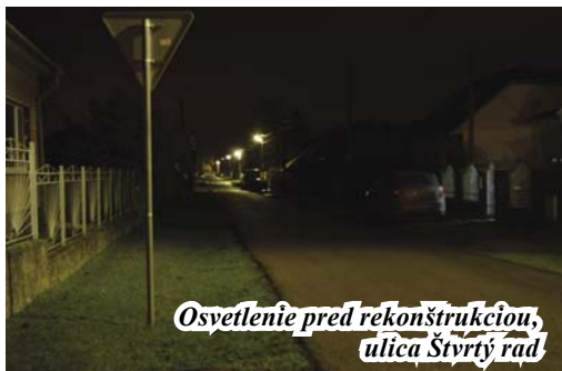
Osvetlenie pred rekonštrukciou, ulica Štvrtý rad