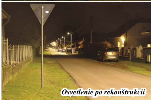
Osvetlenie po rekonštrukcii

príspevku medzi poskytovateľom Ministerstvom hospodárstva SR a prijímateľom obcou Mojmírovce so sídlom Námestie sv. Ladislava 931/7 Mojmírovce. Začiatok aktivít projektu bol plánovaný v termíne jún 2015 - ukončenie projektu - december 2015. Celkové náklady projektu boli vyčíslené v čiastke 654 314,22 €, z toho celkové oprávnené výdavky 543 065,75 €. Zhotoviteľom diela je spoločnosť ELTODO OSVETLENIE, s.r.o., Rampová 5, Košice.