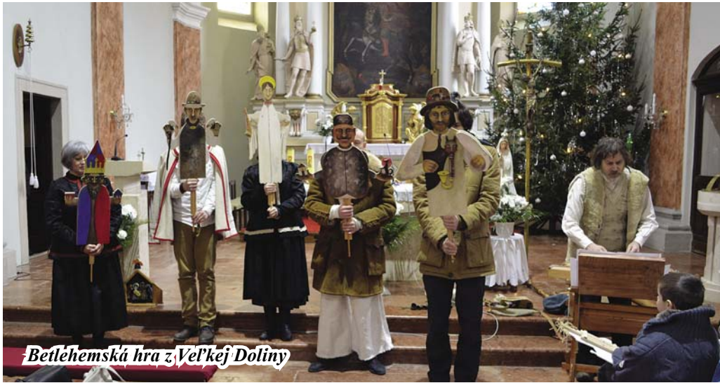
Betlehemska hra z Veľkej Doliny