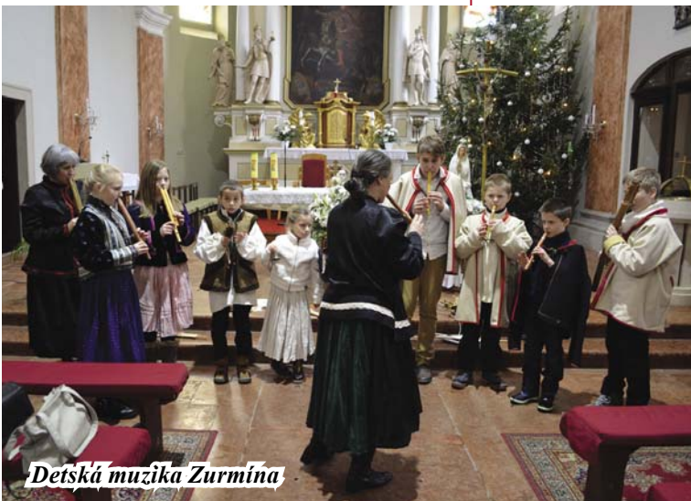
Detská muzika Zurmína

Text: Mgr. Mária Žilíková- -Mandáková, PhD.