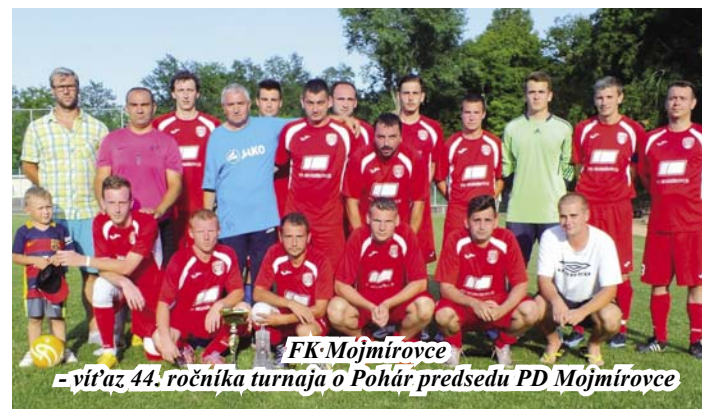
FK Mojmirovce - víťaz 44. ročníka turnaja o Pohár predsedu PD Mojmirovce