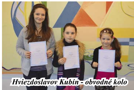
Hviezdoslavov Kubín - obvodné kolo

Hviezdoslavov Kubín je tradičnou a všeobecne známou súťažou v prednese poézie a prózy. Mladí recitátori v nej každoročne prezentujú svoj vzťah ku krásnej literatúre.