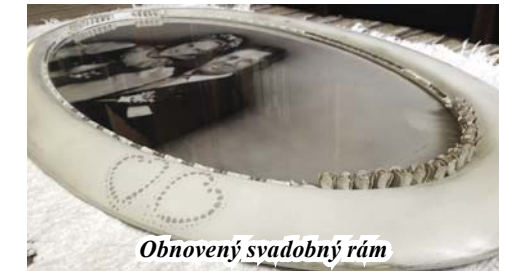
Obnovený svadobný rám

zmesi, bylinné sirupy, olejové maceráty, masťičky či likéry. Jej druhou vášňou sú staré veci, ktoré pretvára pod názvom Recyky od HAMUJ . Rôznym stolíkom, stoličkám, rámikom a kufrom dáva nové využitie v podobe nábytkových solitérov a doplnkov. V jej tvorbe sa nájdú aj drobnosti pre potešenie, náušnice, náramky či brošne a rôzne recyklované výrobky zo stužiek, kartónov, plechoviek, skla a oblečenia.