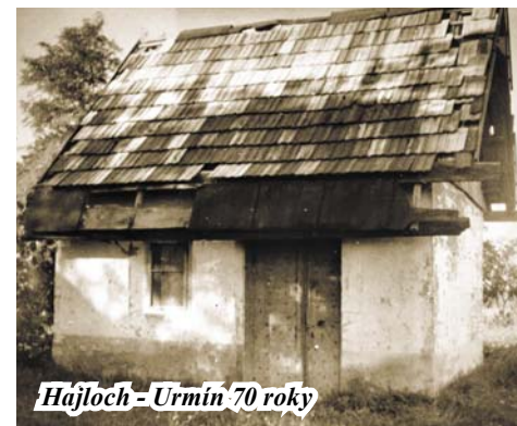
Hájloch - Urmín 70 roky

Začiatkom 19. storočia sa druhy vín na panskom stole rozšírili o vína tokajské a francúzske (burgundské, Champagner, biele aj červené z Bordeaux, odrody Curasevaux a iné). Okrem nich to boli samozrejme vína z domácich vinohradov.