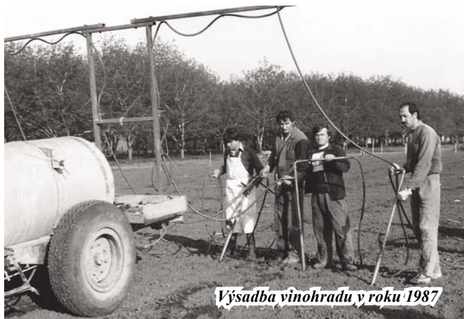
Výsadba vinohradu v roku 1987

Vysadili sme 12 ha bielych aj modrých odrôd.