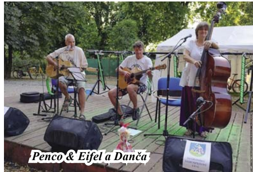
Penco & Eifel a Danča