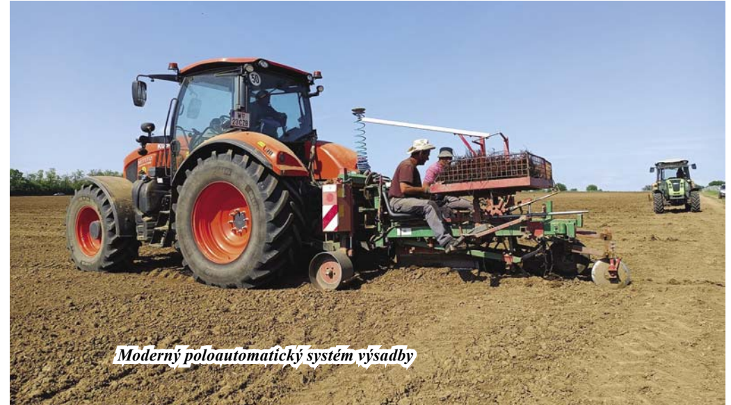
Moderný poloautomatický systém výsadby

Do výsadby sme zakomponovali klasické odrody osvedčené v našich podmienkach, ako Rizling vlašský, Rizling rýnsky, Frankovka modrá, Müller Thurgau, Rulandské modré, Muškát Ottonel, ale máme i dve novinky, Nitriu a Torysu. Spolu s výsadbou z roku 2014 máme v našich viniciach šesť odrôd slovenských novošachtencov – biele Noriu a Miliu a modré Dunaj a Hron, ktoré sa zatiaľ všetky ukazujú ako veľmi perspektívne pre našu oblasť. Od noviniiek, modrých odrôd Nitria a Torysa, očakávame podobné výsledky. Pôvodné osvedčené odrody sme sa rozhodli vysadiť s ohľadom na zachovanie tradície ich pestovania. Sú to odrody, ktoré sa z dlhodobého hľadiska veľmi osvedčili. Vína z týchto odrôd, nesúce znak nášho terroiru, sú vyhľadávané odborníkmi i laickou verejnosťou a dopyt po nich neustále rastie.