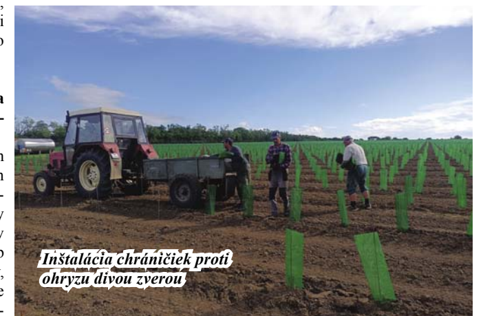
Inštalácia chráničiek proti ohryzu divou zverou

bom bola realizovaná podstatná časť súčasnej výsadby našich viníc a používala sa až do nedávna. Po prvýkrát sa pri výsadbe vinohradov v Mojmirovciach použil moderný strojový systém. Viničové sadenice vysádzalo poloautomatické zariadenie, ktoré bolo navádzané cez systém GPS, vďaka čomu sme dosiahli výnimočne presnú výsadbu. Toto zariadenie obsluhovali traktorista a dvaja pracovníci, ktorí umiestňovali sadenice do podávača, ktorý sa postaral o umiestnenie na požadované miesto. Celkovo sme týmto spôsobom vysadili 49 100 viničových sadeníc v priebehu piatich dní. Výsadbu sme realizovali v osvedčenej vzdialenosti radov od seba 2,6 m, ale vzdialenosť medzi jednotlivými