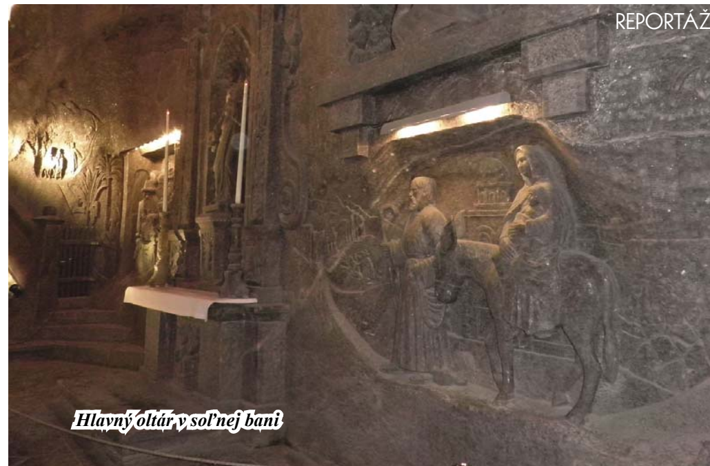
Hlavný oltár v soľnej bani

Naša exkurzia trvala asi tri hodiny. Počas nej sme videli snáď všetko, čo Wieliczka turistom ponúka. Podzemné jazierka so slanou vodou, ťažobné komory, banské stroje a zariadenia, stáročne drevené konštrukcie výborne zakonzervované