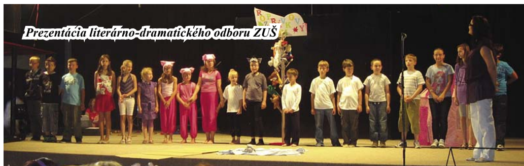
Prezentácia literárno-dramatického odboru ZUŠ