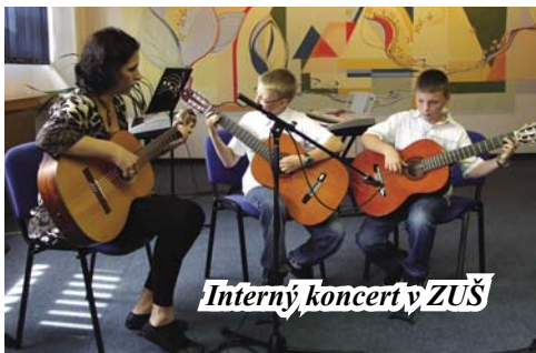
Interný koncert v ZUŠ

Ani sme sa nenazdali a záver školského roka je tu. Naši žiaci sa po celý rok svedomito pripravovali na vyučovacie hodiny a výsledky svojej práce nám prezentovali na koncertoch a vystúpeniach. Interný koncert sa uskutočnil