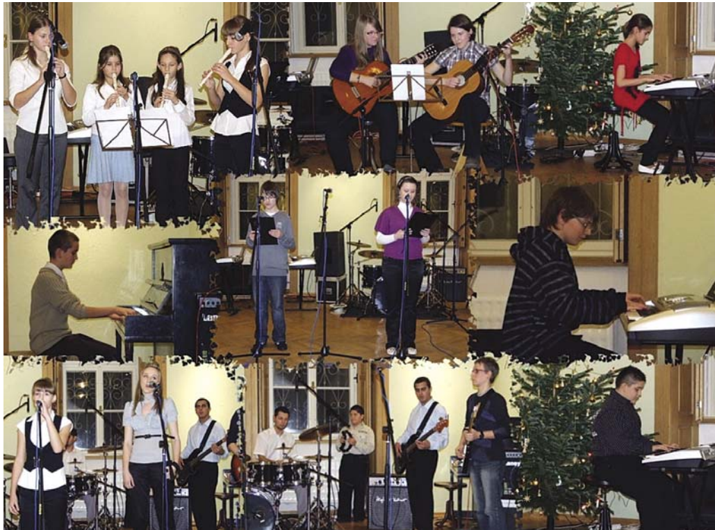
Vianočný koncert ZUŠ v Mojmirovciach, foto: Juraj Arpáš