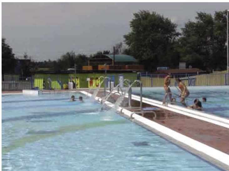
Bazén na kúpalisku Vincov les

Tiež sme prispeli na rôzne akcie pripravované OcÚ, napríklad v mesiaci úcty k starším. Sponzorsky sme prispievali – Nadácii medzinárodnej lekárskej pomoci, Občianskemu združeniu Červený nos, ktorého členovia navštevujú choré deti v nemocniciach a obveselujú ich svojim programom. Tiež poľovníckemu združeniu, Mojmírovskej kapele – dychovej hudbe, umelcom maľujúcich ústami a nohami. Pred Vianocami sme navštívili našich jubilujúcich členov – dôchodcov a odovzdali sme im vianočné balíčky, ktoré s vďakou prijali. Taktiež sme poskytli balíčky našim dôchodcom žijúcim v Domove sociálnych služieb Barlička v Mojmírovciach.