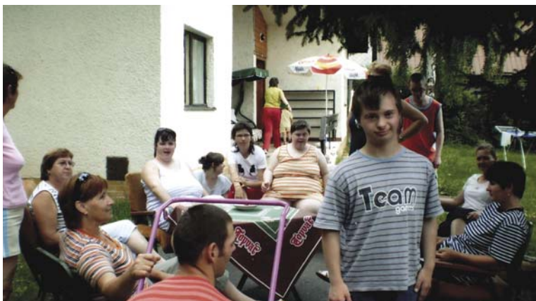
Chvíľa oddychu na Duchonke

V roku 2009 sa striedala práca s oddychom. Dňa 16.4.2009 naše zariadenie navštívilo divadielko s bábkovým predstavením PETRUŠKA. Naše deti prišli pobaviť a rozveseliť študenti 3. ročníka bábkarskej tvorby VŠMU. V júni sme tradične usporiadali stretnutie pri príležitosti Dňa detí v športovom areáli na ihrisku u pani