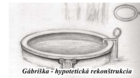
Gábriška - hypotetická rekonštrukcia

hranatý bazén so schodami už neexistuje. Škodá, lebo v období horúceho leta ma osviežovala prítomnosť vodnej hladiny a určite aj malých živočíchov. Ani pred bývalou poštou už bazén neuvídite. Voda z tohto zdroja bola mimoriadne chutná! O vodu bol vždy veľký záujem. Aj dnes, hoci kvalita vytekajúcej vody je sporná (údaje sú k dispozícii vo vitrínach) radi plníme fľaše a džbány (po urmínsky demijóny) touto nenahraditeľnou tekutinou.