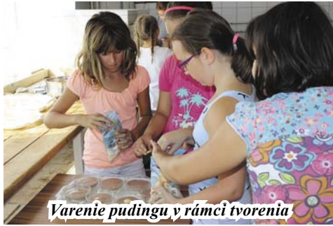
Varenie pudingu v rámci tvorenia

Predstavte si horúce letné ráno, prázdniny, čas keď väčšina detí ešte spí, alebo sa chystá tráviť čas pri vode či počítači. Len skupinka detí sa ponáhľa do kultúrneho domu, aby hrou, zážitkovou formou rozvíjala svoju kreativitu v duchu hesla: Každý človek môže byť tvorivý. Neexistuje netvorivý človek.