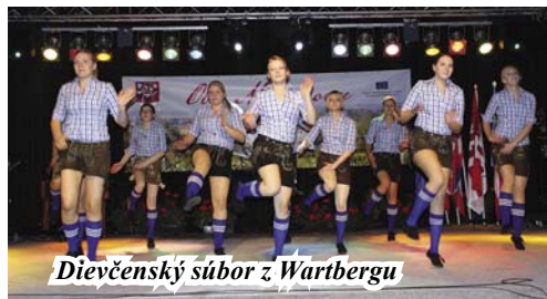
Dievčenský súbor z Wartbergu

Šardičánek z moravskej obce Šardice a dievčenský tanečný súbor z rakúskej obce Wartberg nad Kreamsom. Vo večerných hodinách sa svojim vtipom a piesňami predstavila známa speváčka a zabávačka Aťa Klímová. O tanečnú zábavu sa postarali duo Salco a Miriam, hudobná skupina Kroky Michala Davida, speváčka Simona Hégerová a na záver hudobná skupina Tempo Band.