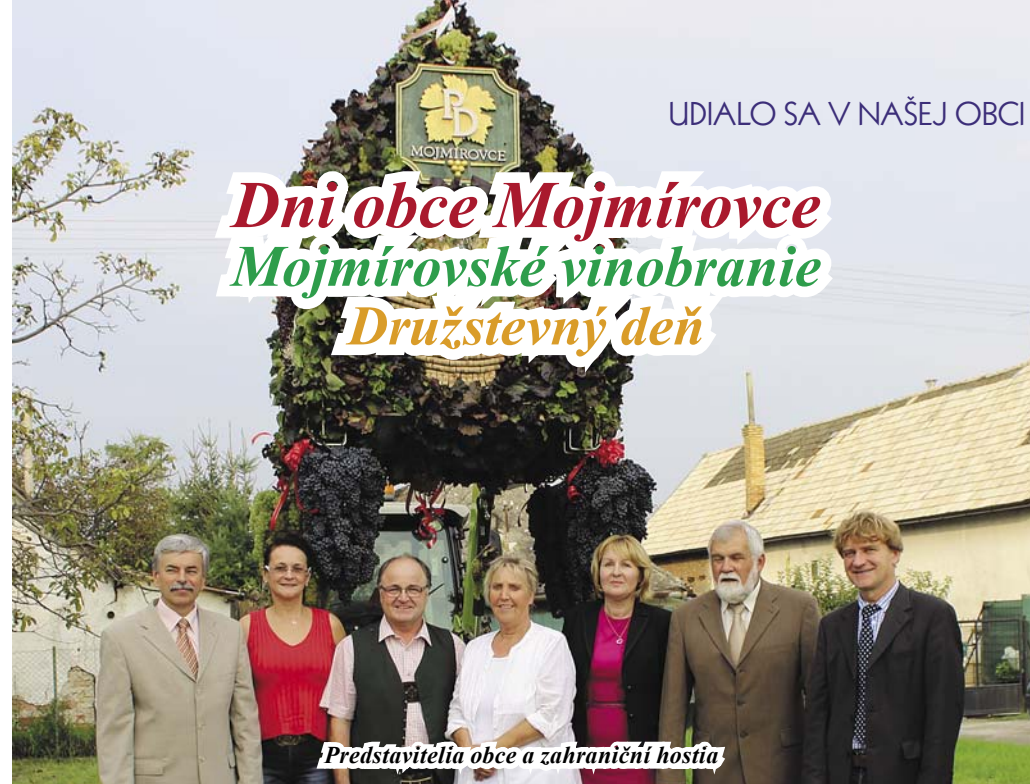
Predstavitelia obce a zahraniční hostia

Tohtoročné Mojmirovské vinobranie – Družstevný deň sa začali v dopoludňajších hodinách ukázkami furmanských pretekov v priestoroch Kolesa. Táto časť podujatia bola zrealizovaná s finančnou podporou Nitrianskeho samosprávneho kraja.