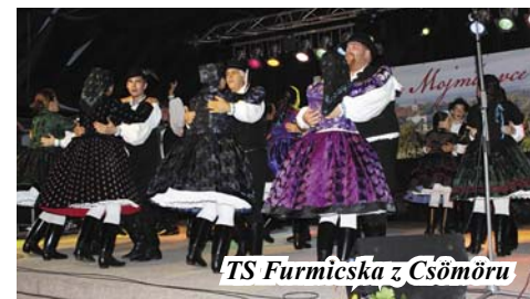
TS Furmicska z Csömöru

Na úvod programu sa predstavili malé mažoretky zo ZŠ v Mojmirovciach, s ľudovými piesňami sa predstavila Cimbaločka URMÍN zo ZUŠ v Mojmirovciach, country tance zatancovali ženy z tanečnej skupiny Country a nechýbal ani náš ľudový spevácky súbor SENIOR so svojimi krásnymi ľudovými piesňami. Otvorenia slávnos-