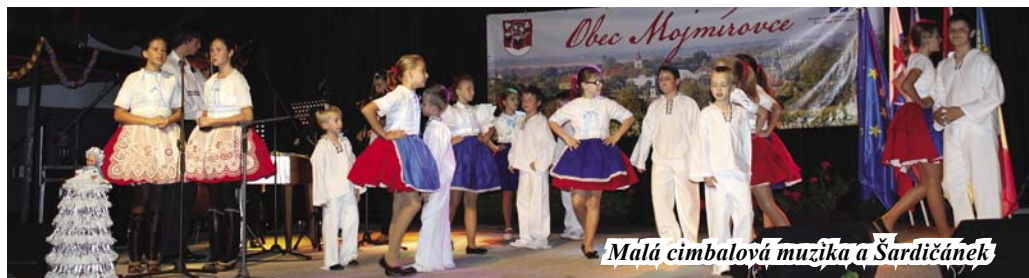
Malá cimbalová muzika a Šardičánek