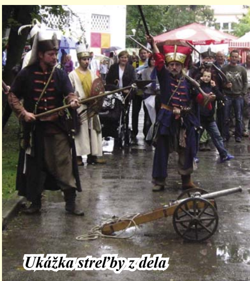
Ukážka streľby z dela

Program sa začal o 13,00 hodine sprievodom členov Divadelno-kaskadérskej spoločnosti Tostabur Espadrones z námestia a príchodom do kaštieľa cez hlavnú bránu. V sprievode nechýbali janičiari, mehter, fakíri, ale i tanečnice a historická hudba. Keďže počasie nebolo priaznivé a stále pršalo, po úvodnom privítaní a otvorení tureckého jarmoku sa účinkujúci presunuli do kongresovej sály, v ktorej bol postavený turecký stan. V sále sa odohrával