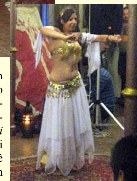
Tanečnica predvádza turecký tanec

sledovali ukážky rôznych súbojov a prezentácia o súčasnom Turecku - krajine pamiatok a zaujímavosti. V podvečerných hodinách tanečnice