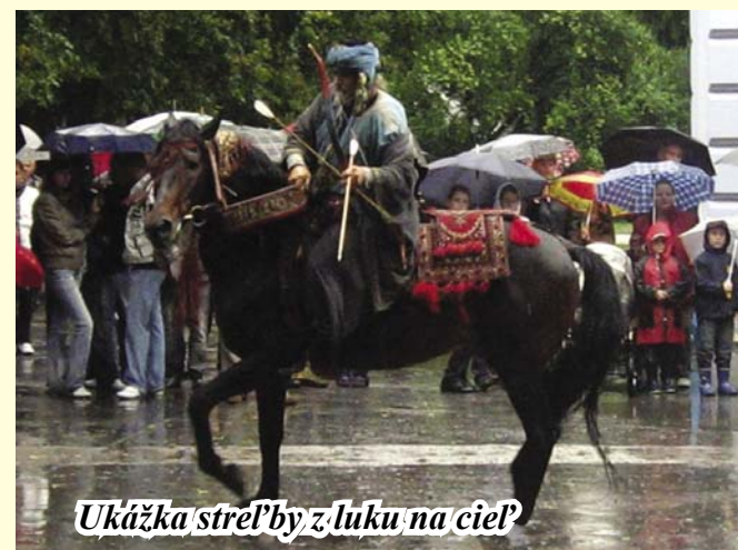
Ukážka streľby z luku na cieľ

Na záver slávnosti vystúpila country skupina Pengagi, pri ktorej si mnohí návštevníci s radosťou zatancovali.