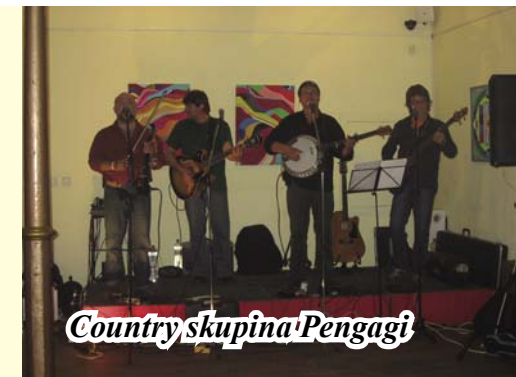
Country skupina Pengagi