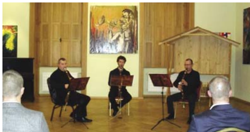
Viac info na: www.lotzt trio.com

13. decembra predvianočnú atmosféru umocnil koncert skupiny Lotz, ktorý sa konal v Kaštieli Mojmirovce. Táto formácia je známa hraním na kópiách unikátnych basetových rohoch z hradu Krásna Hôrka a z ich repertoáru si prítomní vypočuli skladby od W. A. Mozarta, ale aj vianočné koledy v úprave pre 3 basetové rohy.