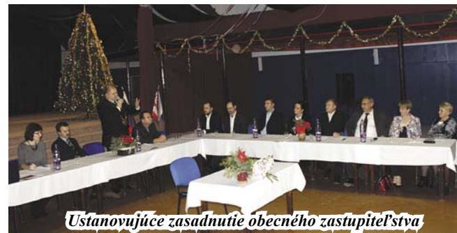
Ustanovujúce zasadnutie obecného zastupiteľstva

Komisia pre správu majetku obce, financie a podporu podnikateľskej činnosti