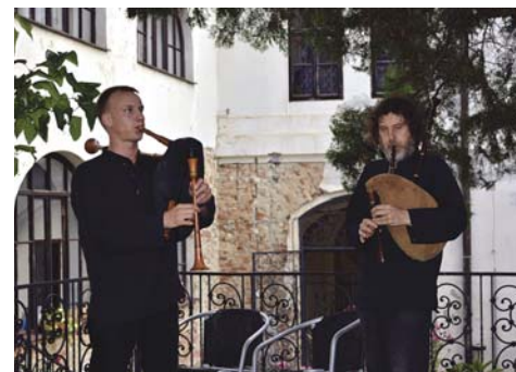
robylá pastierska - súvisí s pastiermi sviň, udržala sa do 20. storočia v roľnícko-poľnohospodár-