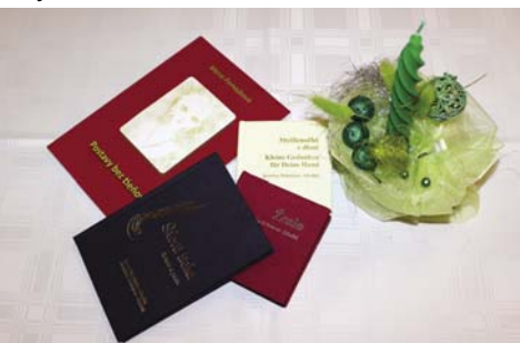
text: tt