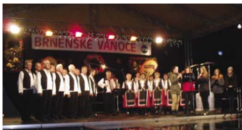
text a foto: tt

Odtiaľ sme sa už viezli do Brna, ale najskôr sme si prezreli krásnu a rôznorodú výstavu betlehemov, vianočných ozdôb a dekorácií v letohrádku Mitrovských. Vianočne inšpirovaní sme sa presunuli na Brnenské vianočné trhy a vychutnávali miestnu atmosféru pri vianočných pochutinách a netrepeľivo čakali na vystúpenie nášho speváckeho súboru Senior a ZUŠ Mojmirovce. Vystúpenie malo úspech, atmosféra bola veselá, všetci sme sa z tohto vystúpenia tešili.