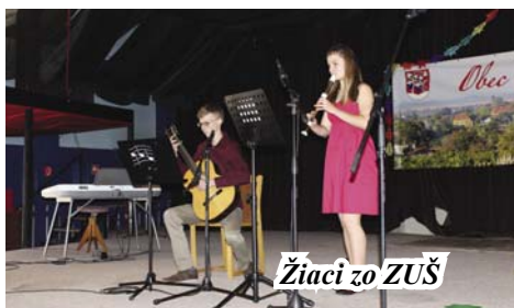
Žiaci zo ZUŠ

Deň matiek patrí už k tradičným podujatiam usporiadaným obcou Mojmírovce. I v tomto roku sa táto akcia uskutočnila v spolupráci s Materskou školou, Základnou školou a Základnou