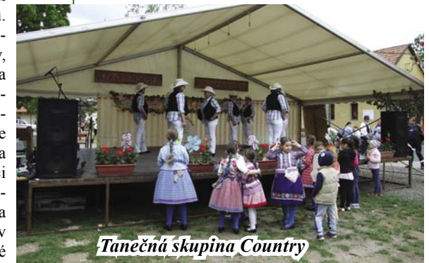
Tanečná skupina Country