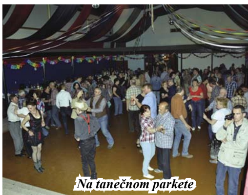
Na tanečnom parkete

„Skvelé!... To je zábava!... Výborná muzička...!“ a rôzne podobné vyjadrenia zneli v sále KD v Mojmirovciach 25. 4. 2015 na countrybále usporiadanom obcou s podporou OZ INŠPIRÁCIA. Bolo to pre nás aj isté zadost'učinenie, keď nás oslovil náš starosta, či by sme mohli skúsiť zábavu v štýle country. Išli sme do toho sice s odhodlaním, ale aj s malou dušičkou, veď u nás zatiaľ country zábava dlhšiu tradíciu nemá.