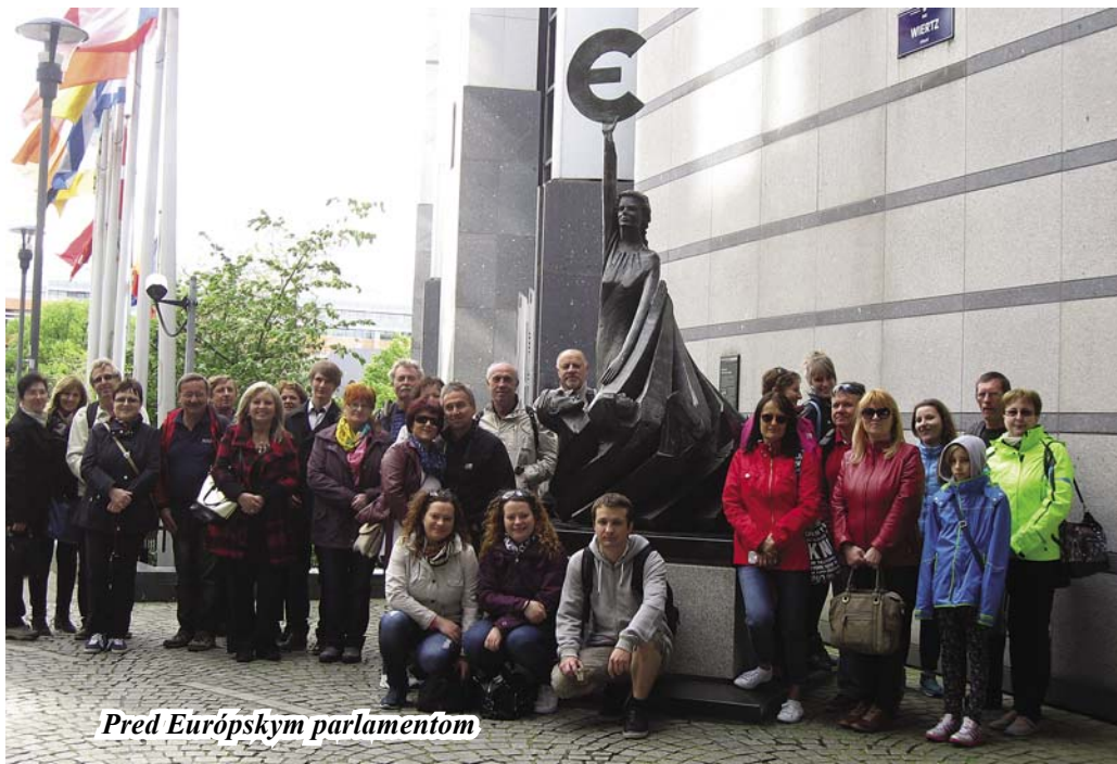
Pred Európskym parlamentom