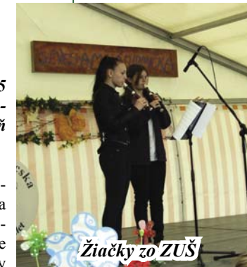
Žiačky zo ZUŠ