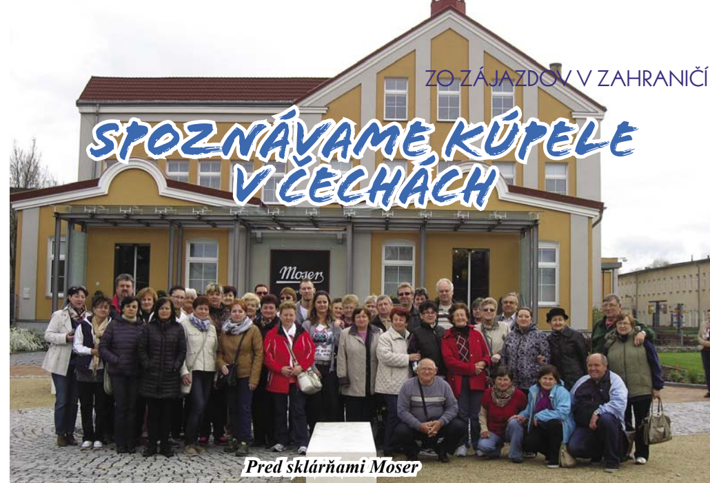
Pred sklárňami Moser

V posledný aprílový deň a prvé májové dni usporiadal TIK CESYS štvordňový poznávací zájazd do západných Čiech.