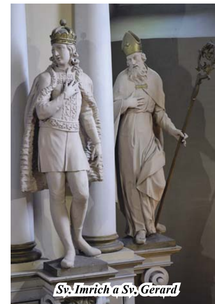
Sv. Imrich a Sv. Gerard

prvkami: konzoly s volútami, zalomené rímky, akantové listy, korintské hlavice stĺpov, girlandy, členitá kartuša s mariánskym monogramom, zuborezový lem, kalichy hojnosti, obetný stôl s tabernákulom (svätostánkom) a kľáčiacími zlátenými anjeli po bokoch, krížik s volútami. Samotné sochy na sokloch dynamikou tiel v nadživotnej veľkosti naznačujú pohyb, gesto. Sú zo zadného pohľadu vydlabané z dreva so stopami po dláte. Z ľavej strany predstavujú sv. Benedikta z Nursie a sv. Štefana kráľa. Na pravom kraji oltára stojí sv. Imrich kráľovič a sv. Gerard. Súčasťou oltárnej architektúry sú sochy žien, vpravo sv. Alžbeta Uhorská a vľavo sv. Mária Magdaléna. Oltárna architektúra siaha až po strop hlavnej lode kostola.