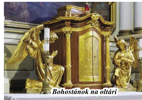
Bohostánok na oltári