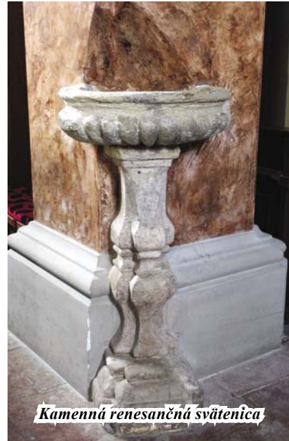
Kamenná renesančná svätenica

Barokový interiér preteplujú dlažobné kocky 40 x 40 cm z červeného mramoru privezené z Tardoša. Aj veľká mramorová doska z Tardoša o rozmere 1,2 x 2 m pred svätyňou zakrýva vstup do krypty. Pozoruhodné sú tiež dve svätenice.