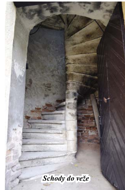
Schody do veže