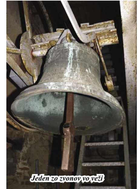
Jeden zo zvonov vo veži

poblúdenie, hriech. Neustály zápas svetla a tmy sa podobá vzostupom a pádom našich životov.