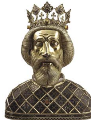
Herma sv. Ladislava

Svätý Ladislav, ktorému je od roku 1721 zasvätený náš kostol, je významnou historickou osobnosťou nielen ako svätec, ale aj ako uhorský panovník. Narodil sa okolo roku 1040 v Poľsku poľskej kňaznej Rykse a budúcemu uhorskému kráľovi Belovi, príslušníkovi vazulovskej vetvy Arpádovcov (jej konkurentom bola rodová línia zakladateľa Uhorského kráľovstva, Štefana I.).