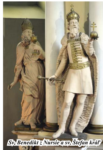
Sv. Benedikt z Nursie a sv. Štefan kráľ